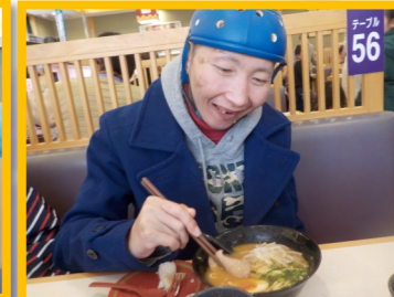
かしまじんぐう 鹿島神宮 ずし はま寿司