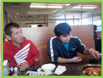
たからじま 宝島、 たまご とよんちの卵