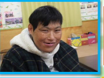
どう ぼり 道とん堀 ティータイム