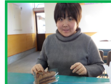
ぜん とん膳 ふじや 不二家