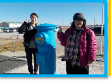
くじゅうくりみち えき 九十九里道の駅 カフェ