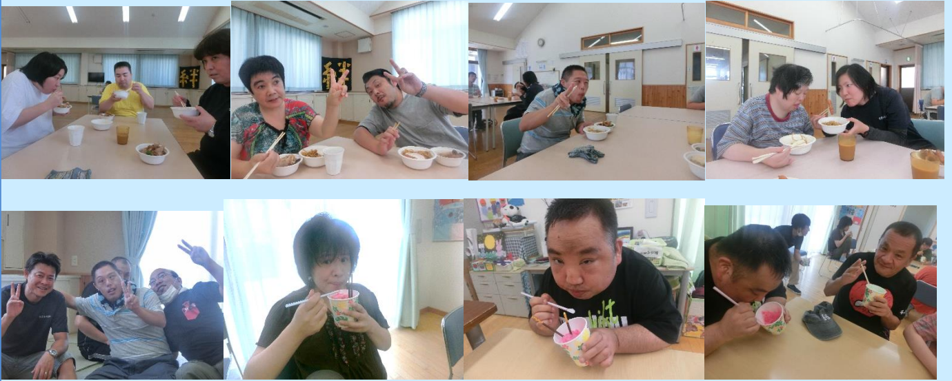
夏といえばかき氷！