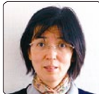
ソーシャルワーカー