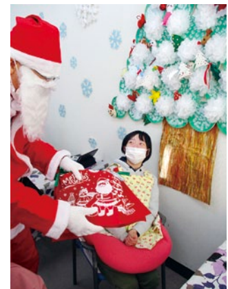
サンタさんが来た(°^°)♪