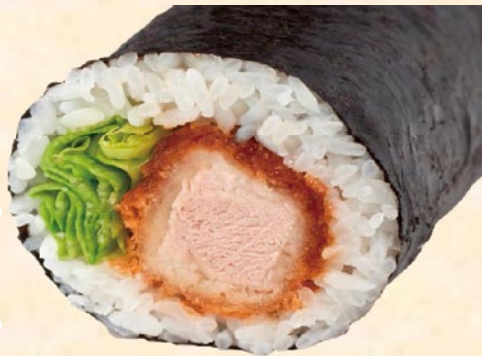
ヒレカツ巻(ハーフ)