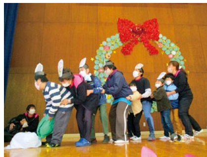
うんとよしよ! じょうよしよ!!