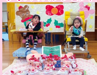
お菓子とオーナメントをいただきました