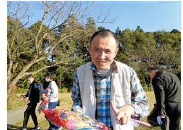
ミニゲームの景品ゲット!