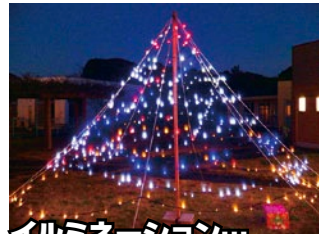
イルミネーション 今年も中庭に巨大ツリー★