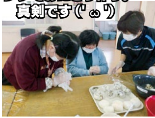
レクでおにぎり作り。 真剣です(°ω°)