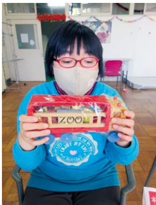
クリスマスプレゼントもらったよ♪