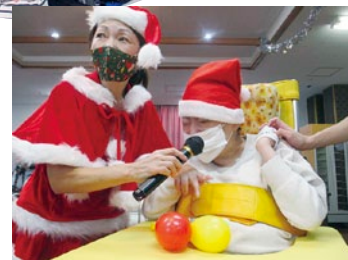
クリスマス食事会で♥熱唱♥