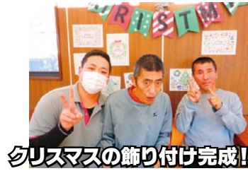
クリスマスの飾り付け完成!