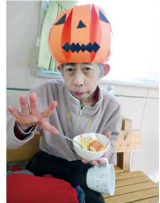
ハッピーハロウイン!