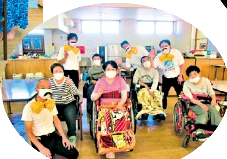
お楽しみ会にて レッツ!ひびダンス!!