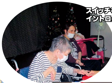
スイッチを押して イントロクイズ!