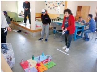
レクで輪投げに挑戦!(°◇°)♪